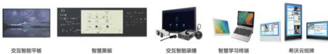
图4：希沃数字化硬件产品

交互智能平板是数字化教学硬件的核心产品，又称交互式液晶一体机，是以高清或超高清液晶屏显示，集成计算能力、多点触控、网络连接、音视频采集能力于一体的设计，可实现互动白板书写、课件演示、远程教学，并具有强兼容性、响应速度快、低辐射，低功耗的特点。除此之外，数字化教学硬件产品还包括智慧黑板、交互智能录播、云班牌、智能学习终端等。