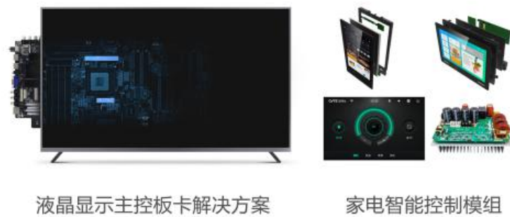
图1：部件业务主要产品

随着当前新一代显示技术的进步和新型显示形态的电视问世，公司逐步随客户需要提供相应的电视主控板卡设计方案。此外，公司部件业务还为客户提供TV电源、白家电控制组件等核心部件及定制化的解决方案，致力于成为全球消费和商用电子产品主控板卡的设计服务商。