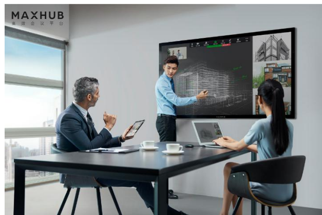
图7：MAXHUB交互智能平板产品

企业服务业务以MAXHUB高效会议平台为核心产品，通过交互智能显示终端、无线传屏、会议门牌、云会议等多维度软硬件产品，能够满足用户全会议场景的沟通需求，为用户带来显示、交互、协同的一体化体验，营造高效协同的办公方式。MAXHUB会议平板是一款集投影仪、电子白板、远程设备、平板电脑、会议音响于一体的会议终端，产品具有高清显示、触摸书写、无线传屏等功能，具备远程会议配置，兼容多种远程会议软硬件，可搭载丰富的办公应用，可应用于金融机构、科技行业、地产企业、咨询服务行业、政务组织等各行业领域的会议场景中。