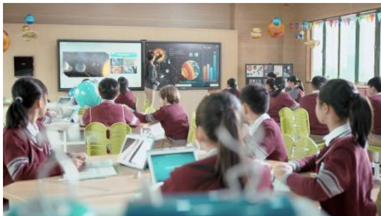
图2：希沃教学应用场景

希沃提供的教育信息化应用工具主要分为三大类产品：数字化教学硬件、常态化应用软件、教师培训与大数据服务。这些产品或服务紧紧围绕“教师、教室、教学”的“三教”定位，从教学应用场景出发，区分学段和线上线下，多维度构建完整的教育信息化应用场景。以硬件设备为基础，完善教学软件体系，打通了教学环节的模块，对教学大数据进行无缝采集，最后通过呈现、分析大数据，辅助教学管理决策，助力教学优化，帮助教师发展。