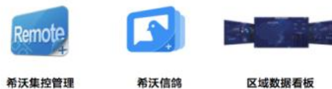
图6：希沃数据管理与服务产品

为了学校实现校园教学场景的全面信息化管理，希沃开发了数据管理与服务应用软件，主要为希沃集控管理软件、希沃信鸽、区域数据看板等产品，旨在辅助教学管理决策，助力教学优化。